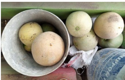
Gambar 10. Buah melon yang jatuh sendiri