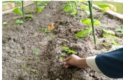
Gambar 5. Penyiangan gulma