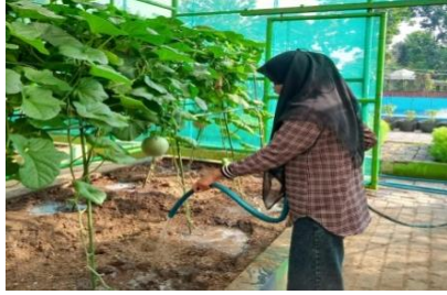
Gambar 1. Pemberian air pada tanaman