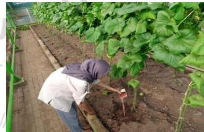
Gambar 4. Pemberian pupuk KCl dan NPK