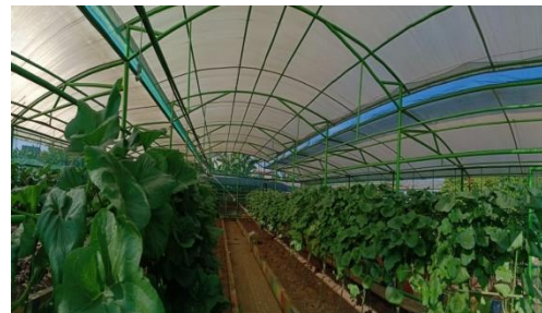
Gambar 16. Lahan greenhouse tampak dalam Sumber : Dokumentasi Widya Oktaviani, Agustus 2022