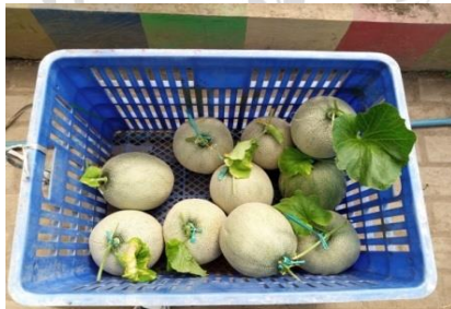
Gambar 9. Pengumpulan buah melon Sumber : Dokumentasi Widya Oktaviani, Agustus 2022