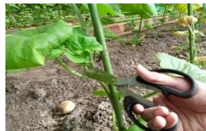
Gambar 6. Pemangkasan daun Sumber : Dokumentasi Widya Oktaviani, Agustus 2022