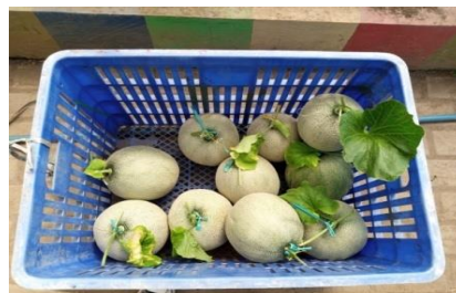
Gambar 11. Buah melon yang dipetik sendiri Sumber : Dokumentasi Widya Oktaviani, Agustus 2022