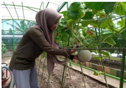
Gambar 8. Panen buah melon