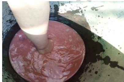
Gambar 3. Pelarutan pupuk KCl dan NPK