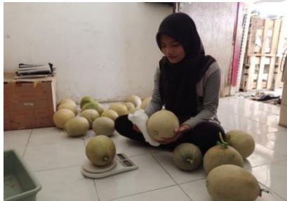
Gambar 13. Pembersihan buah melon Sumber : Dokumentasi Widya Oktaviani, Agustus 2022