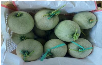
Gambar 14. Penyimpanan buah melon Sumber : Dokumentasi Widya Oktaviani, Agustus 2022