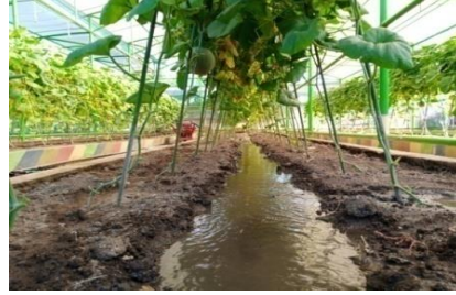
Gambar 2. Pengairan pada parit Sumber : Dokumentasi Widya Oktaviani, Agustus 2022