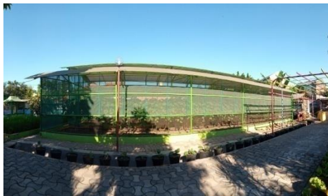
Gambar 15. Lahan greenhouse tampak samping