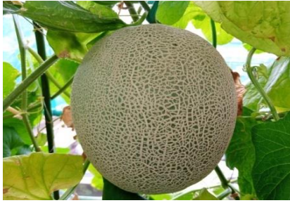
Gambar 7. Penentuan kemasakan buah melon