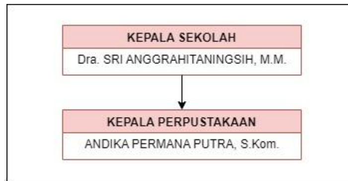
Gambar 2.2 Struktur Perpustakaan SMK Yasmu Manyar Gresik

Berikut Gambar bagan Struktur Perpustakaan SMK Yasmu :