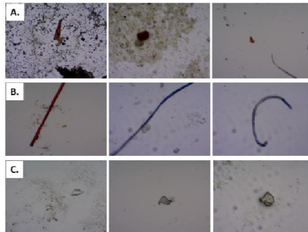
Gambar 2. Jenis mikroplastik yang ditemukan pada rumput laut. Dari kiri ke kanan: (A) Fragmen, (B) Fiber, (C) Film

Jenis alga hijau ini belum banyak dimanfaatkan. Keberadaannya sering diabaikan dan hanya dianggap sebagai organisme laut pada umumnya yang belum dimanfaatkan. Sehingga keberadaannya cukup masif dan tumbuh hingga mencapai bobot 1 kg/individu. Setidaknya teridentifikasi 129 ± 43 partikel/100g mikroplastik pada Halimeda sp. yang ditemukan dari sampel, meliputi 65.8%, fiber 29.0%, dan film 5.2%. Banyaknya mikroplastik dan dimensi organisme mengindikasikan fungsi Halimeda sp. dalam perairan terkait sebagai agen bioakumulator berlangsung pada rentang waktu yang cukup panjang (Subagiyo, 2009).