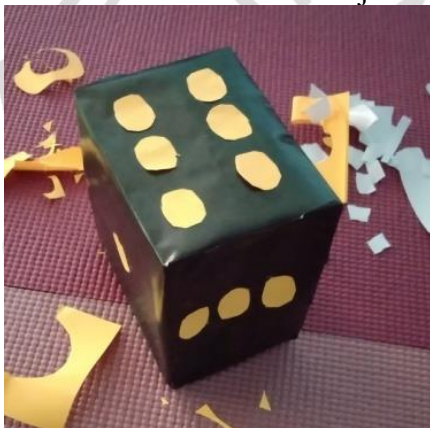
Gambar 2.4 Media Pembelajaran Dadu