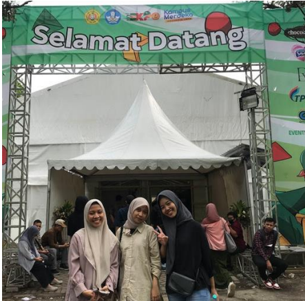
Gambar 4 Kegiatan Expo