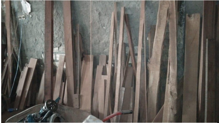
Gambar 7 Limbah Kayu