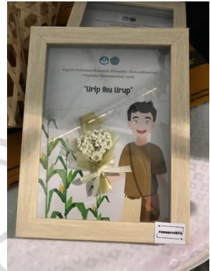
Gambar 5 Produk Pigora