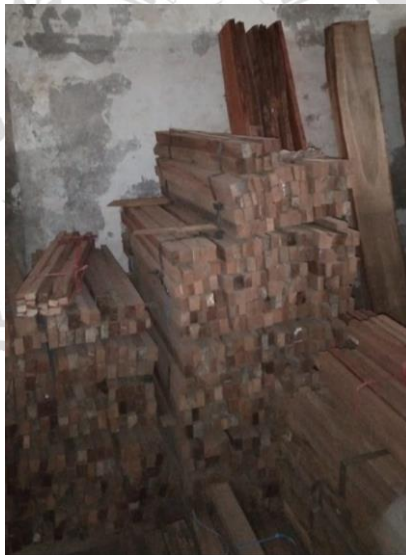
Gambar 3 Kayu