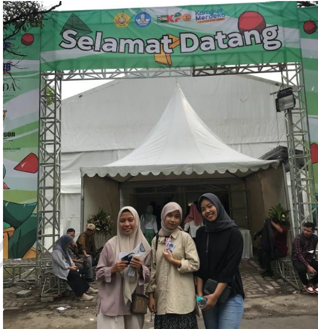
Lampiran 4 Tim Furnesthetic P2MW di KMI Expo 2022