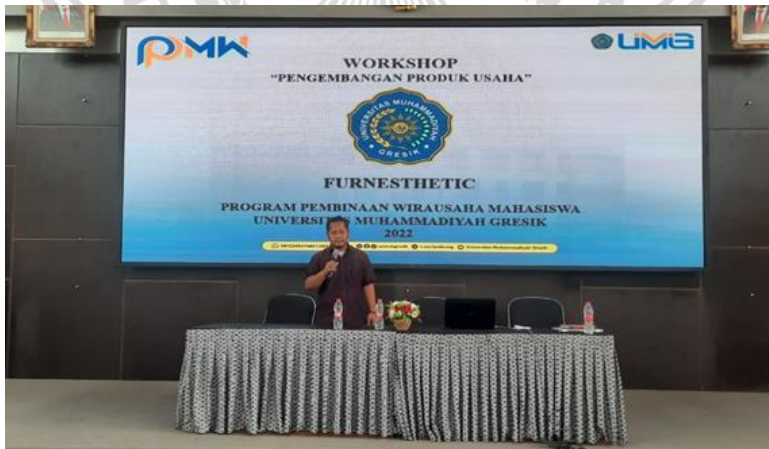
Lampiran 5 Lampiran 7 Workshop Furnesthetic di lingkup UMG