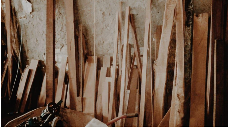
Lampiran 6 Limbah Kayu