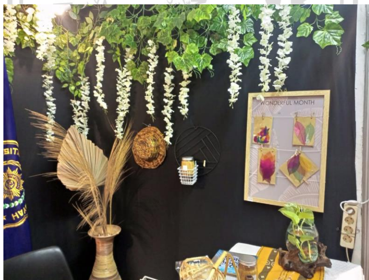
Lampiran 3 Booth UMG di KMI Expo 2022