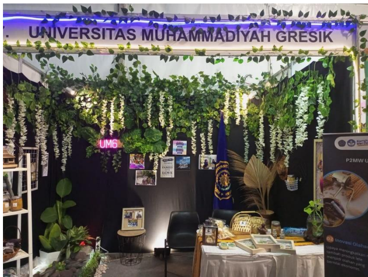
Lampiran 2 Booth UMG di KMI Expo 2022