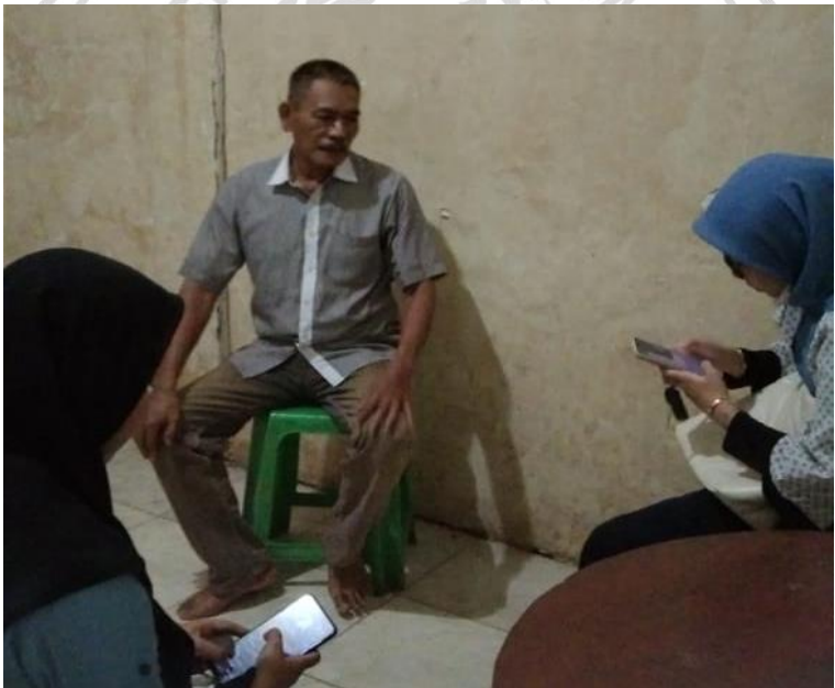
Lampiran 7 Mentoring dengan pihak mitra