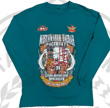
Gambar 2. 4 Produk kaos sablon manual