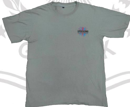
Gambar 2. 5 Produk kaos sablon pres