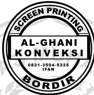
Gambar 2. 1 Logo Perusahaan

Nama : Al Ghani Konveksi Alamat Kantor : Ds. Srirande 1, RT 03 RW 03, Kec. Deket, Kab. Lamongan Alamat Produksi : Pondok Permata Suci, Jalan Topas 3 No. 25, Kec. Manyar, Kab. Gresik Telepon : 082135045225 Email : Win_baliq@yahoo.com