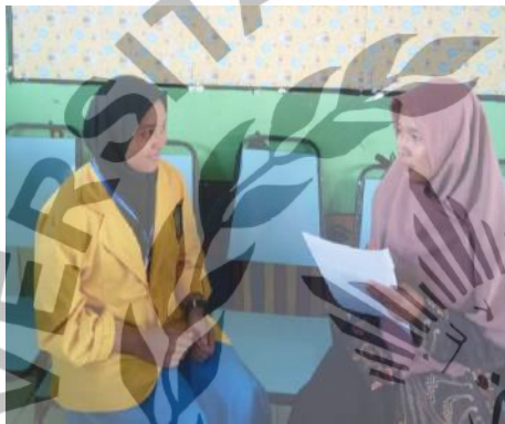
Wawancara dengan Pengurus IPM