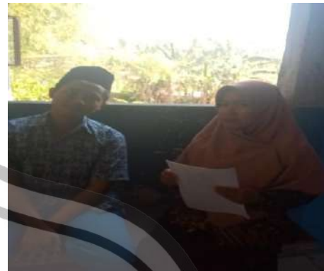
Wawancara dengan anggota IPM