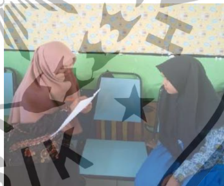
Wawancara dengan Anggota IPM