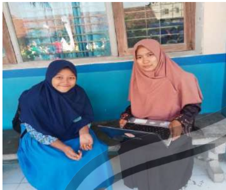
Wawancara dengan anggota IPM