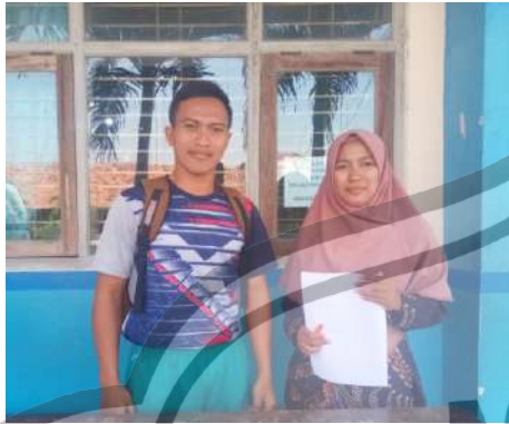
Wawancara dengan Pembina IPM