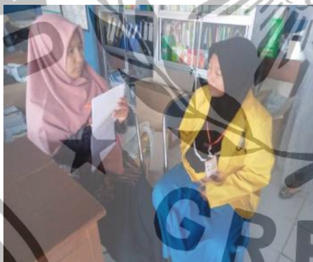
Wawancara dengan Pengurus IPM