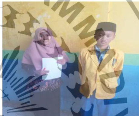
Wawancara dengan Pengurus IPM