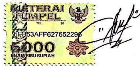
Gita Paramitha Nurriyanti Safitri

Gresik, 20 Januari 2019 Yang membuat pernyataan