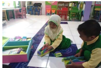
Gambar 2. Dokumentasi kegiatan Treatment (Menyusun Puzzle Sepatu)