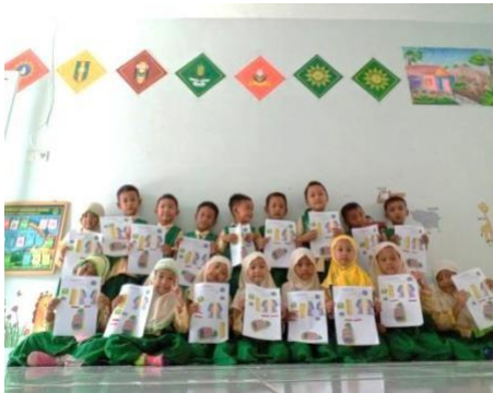
Gambar 5. Dokumentasi kegiatan Posttest

Pada tabel dibawah ini menjelaskan bahwa anak sebelum mendapat perlakuan ( treatment ) media sepatu pintar untuk meningkatkan kemampuan motorik halus anak kelompok B ( pretest ) tingkat kemampuan dalam menyelesaikan tugas dari