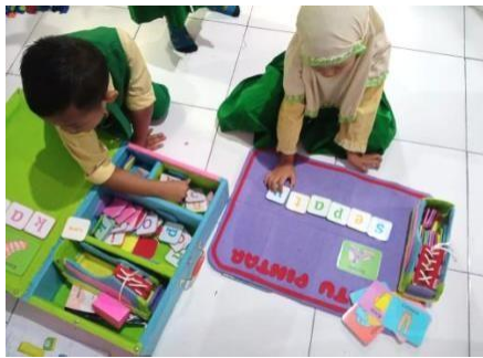
Gambar 4. Dokumentasi kegiatan Treatment (Menyusun Kartu Gambar dan Kartu Huruf)