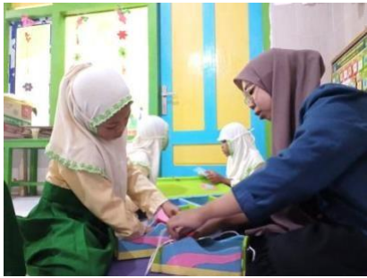
Gambar 3. Dokumentasi kegiatan Treatment (Memasang Tali Sepatu)