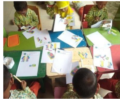
Gambar 1. Dokumentasi kegiatan Pretest

tema kebutuhanku yang disesuaikan dengan media sepatu pintar yang telah dibuat, pada waktu itu kegiatan yang dilakukan yaitu menggunting dan menulis. Setelah kegiatan pretest selesai, peneliti melakukan kegiatan treatment selama 3 kali dengan menerapkan media sepatu pintar dalam pembelajaran. Kegiatan terakhir yang dilakukan adalah posttest , peneliti memberikan LKA (Lembar Kerja Anak) dengan bobot soal sama persis seperti lembar kerja pada saat kegiatan pretest .