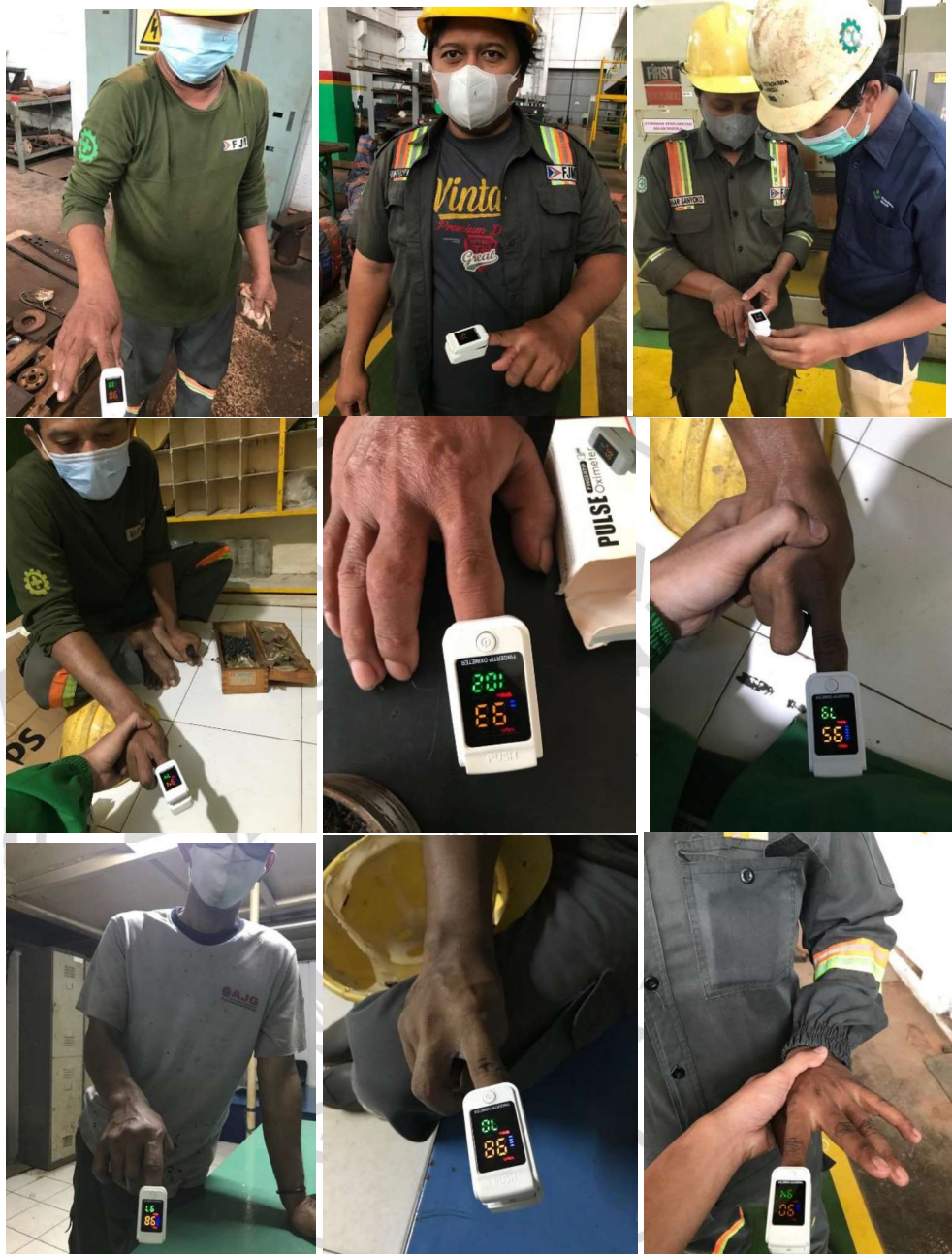
Dokumentasi data denyut nadi pekerja fabrikasi Lampiran 3