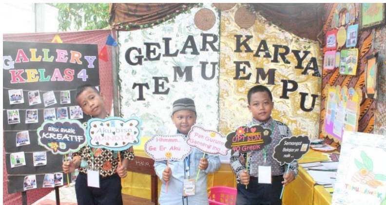
GAMBAR 1. Dokumentasi siswa pada saat perayaan hasil belajar

Antusias siswa dalam belajar tentang Projek Penguatan Profil Pelajar Pancasila (P5) sangat senang, jiwa kewirausahaannya muncul seperti kreatif, inovasi, atau ide-ide baru. Mulai dari pengenalan P5 hingga perayaan hasil belajar mereka sangat semangat, mereka juga lebih banyak mengetahui tentang jenis-jenis tanaman obat keluarga (TOGA) yang bisa dijadikan jamu seperti halnya membuat jamu temulawak dan dijual ke warga sekolah hingga terjual sebanyak 300 botol jamu temulawak. Projek Penguatan Profil Pelajar Pancasila ini sangat bermanfaat bagi siswa, mereka diajarkan pembelajaran diluar sekolah dan melakukan proyek secara nyata. 15