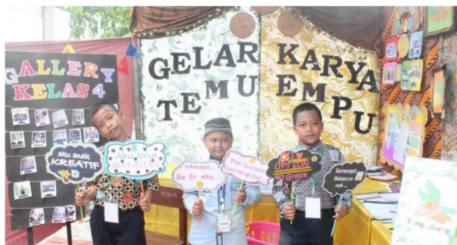
GAMBAR 1. Dokumentasi siswa pada saat perayaan hasil belajar

Antusias siswa dalam belajar tentang Proyek Penguatan Profil Pelajar Pancasila (P5) sangat senang, jiwa kewirausahaanya muncul seperti kreatif, inovasi, atau ide-ide baru. Mulai dari pengenalan P5 hingga perayaan hasil belajar mereka sangat semangat, mereka juga lebih banyak mengetahui tentang jenis-jenis tanaman obat keluarga (TOGA) yang bisa dijadikan jamu seperti halnya membuat jamu temulawak dan dijual ke warga sekolah hingga terjual sebanyak 300 botol jamu temulawak. Proyek Penguatan Profil Pelajar Pancasila ini sangat bermanfaat bagi siswa, mereka diajarkan pembelajaran diluar sekolah dan melakukan proyek secara nyata. 15