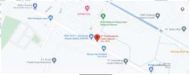
Gambar 2.2 Peta Lokasi Perusahaan

Jl. Raya Roomo No. 242, Maduran, Roomo, Kec. Manyar, Kabupaten Gresik, Jawa Timur, ID 61151.