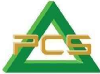
Gambar 2. 1 Logo Perusahaan

Di jantung Kota Gresik, Jawa Timur, Indonesia, Petrokopindo Cipta Selaras (PCS) berdiri kokoh dan senantiasa melangkah dengan tujuan: untuk menjadi solusi di bidangnya dalam menjawab kebutuhan berbagai perusahaan akan sarana logistik. PCS memulai perjalanannya sejak 18 April 1990 silam, didirikan dengan Akta Notaris Djamilah Nahdi, S.H. – Nomor 36 Tahun 1990; dan disahkan melalui Keputusan Menteri Kehakiman Republik Indonesia Nomor: 02- 6316 HT.01.01. Th.90. Sebagai salah satu entitas Yayasan Petrokimia Gresik (YPG), kami membantu induk entitas dan entitas YPG lainnya dalam menggapai visinya, mencapai misi-nya serta menyelaraskan tujuan perusahaan. Pelayanan yang disediakan oleh PT