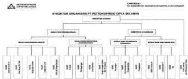
Gambar 2. 2 Struktur Organisasi