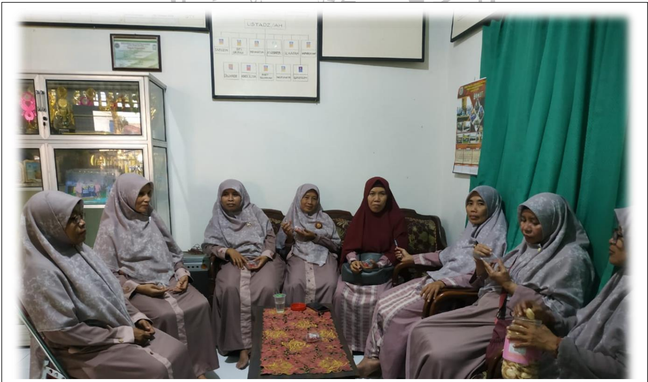
Para Guru TPQ Al-Muttaqin Padang Bandung Dukun Gresik