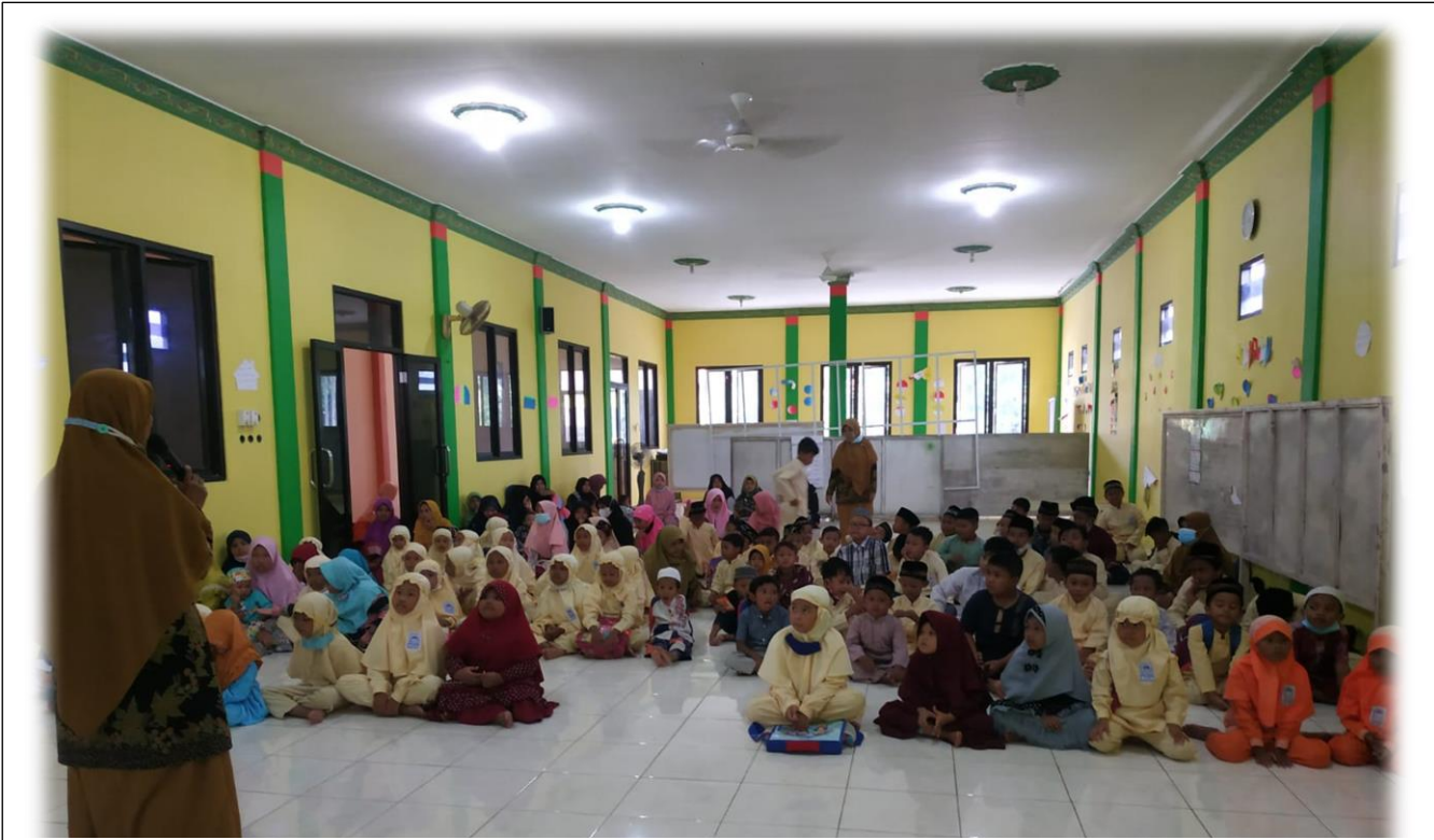
Memotivasi Belajar Santri dengan Bercerita