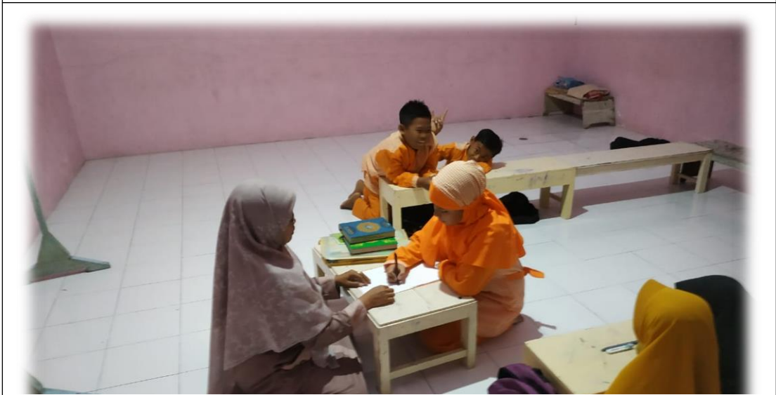
Wawancara dengan Santri TPQ Al-Muttaqin Padang Bandung Dukun Gresik