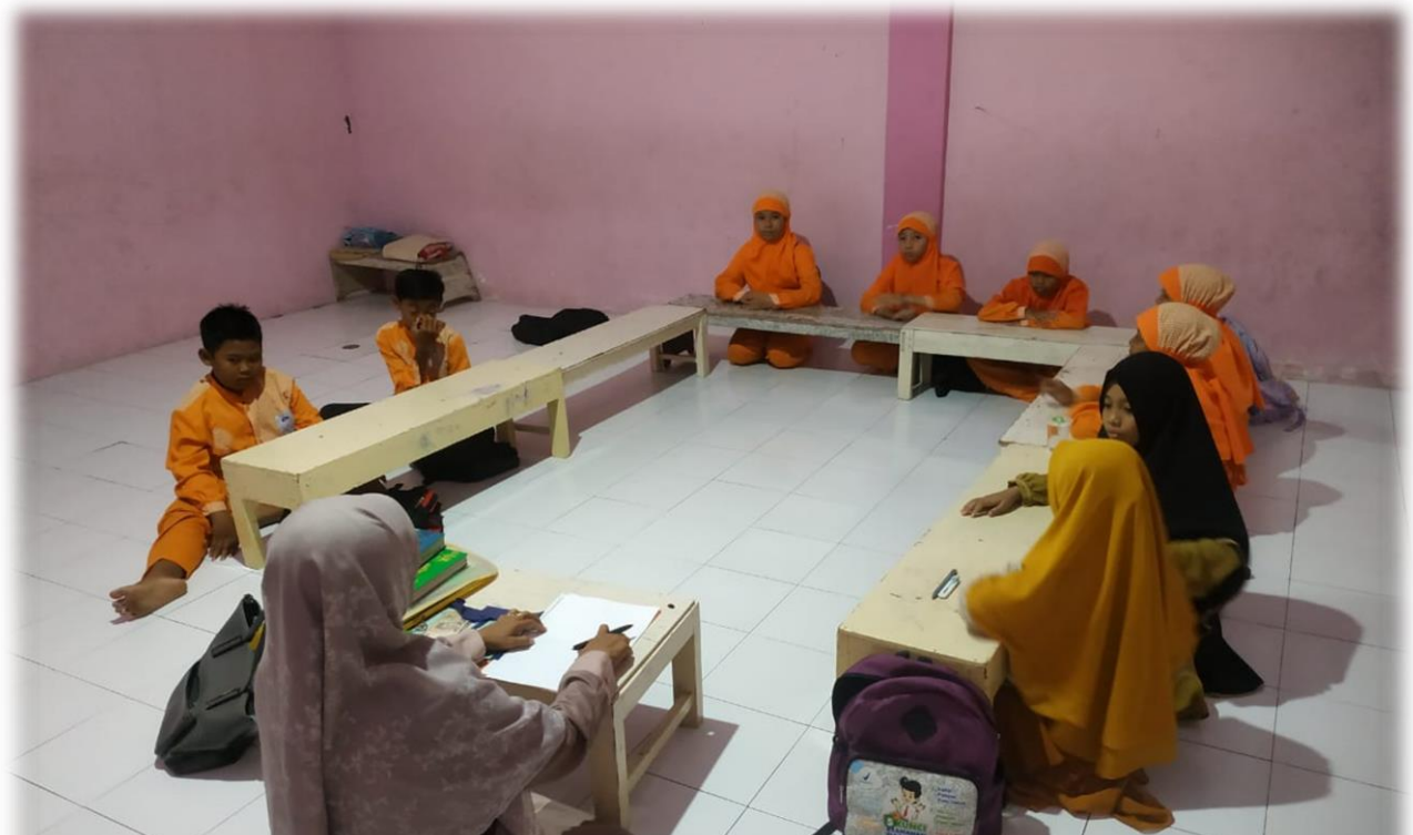
Suasana Saat Proses Pembelajaran