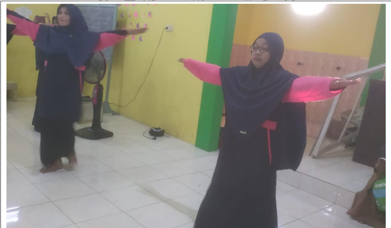
Memotivasi Belajar Santri dengan Senam Gerakan Anak Sholih