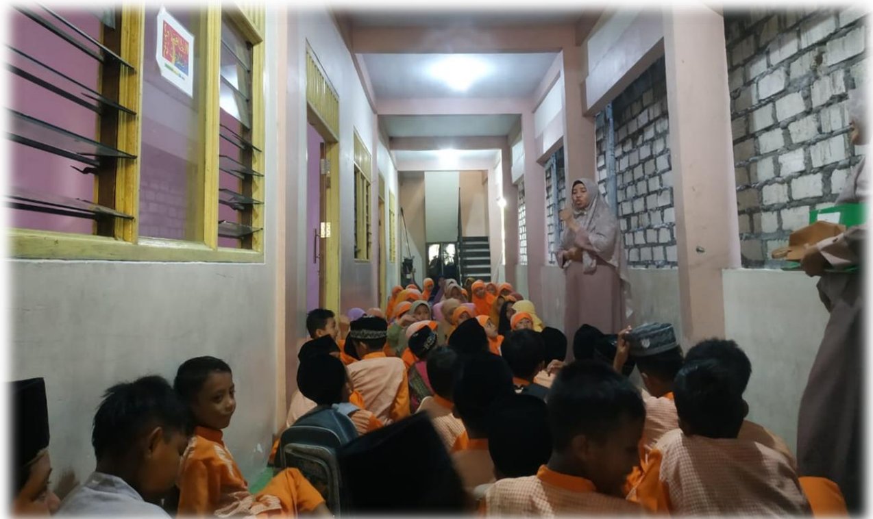
Pemberian Motivasi dan Semangat saat Awal Pembelajaran