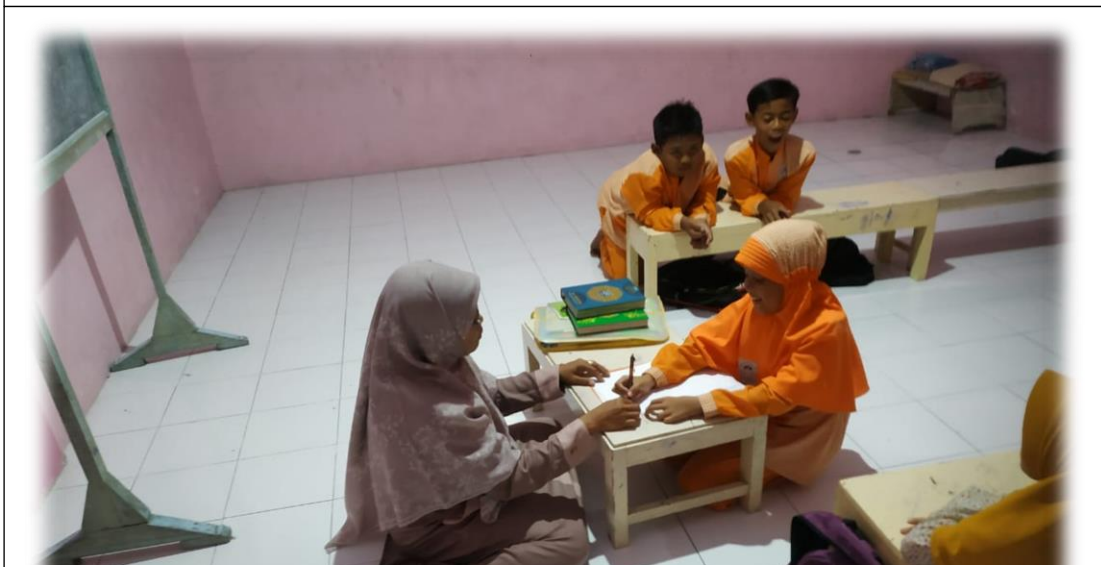
Wawancara dengan Santri TPQ Al-Muttaqin Padang Bandung Dukun Gresik