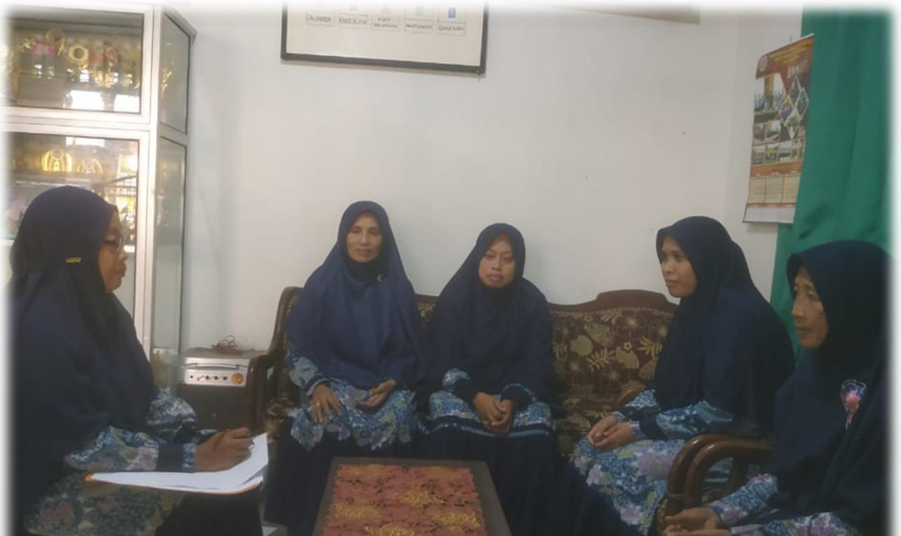
Wawancara dengan Para Guru TPQ Al-Muttaqin Padang Bandung Dukun Gresik