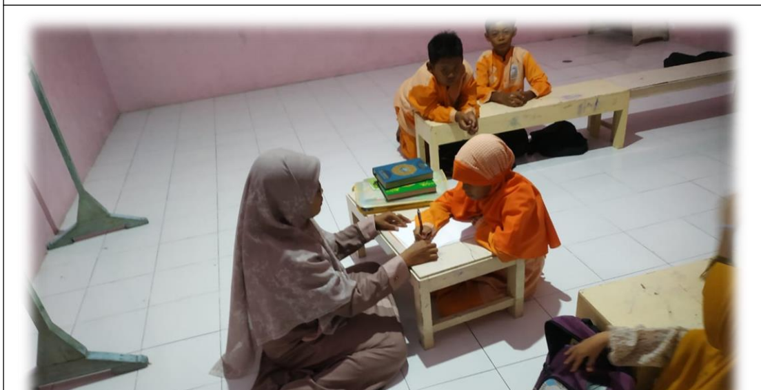
Wawancara dengan Santri TPQ Al-Muttaqin Padang Bandung Dukun Gresik