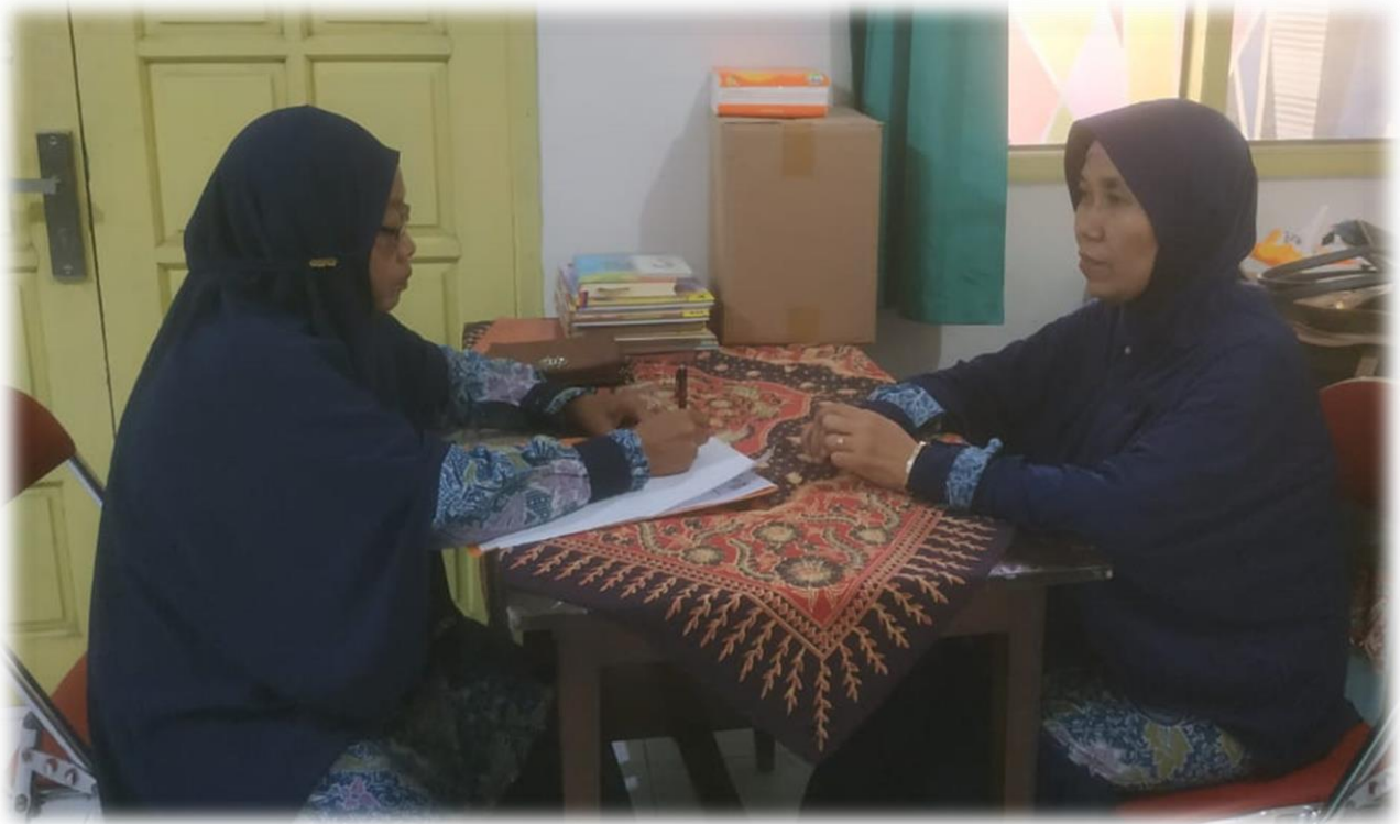
Wawancara dengan Kepala TPQ Al-Muttaqin Padang Bandung Dukun Gresik