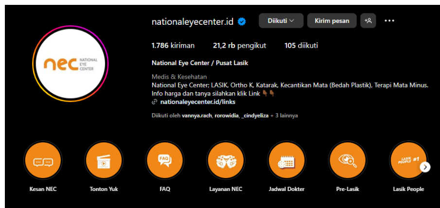
Gambar 2. Instagram National Eye Center

mampu menyebarkan konten yang cukup memberikan banyak edukasi, juga dengan gambaran tentang review para pasien yang telah berkunjung dengan beragam format baik teks maupun video sebagai bukti efektivitas komunikasi pemasaran yang diperoleh serta dampaknya pada masyarakat melalui promosi media social tersebut. Hal ini dapat dilihat dari jumlah followers Instagram National Eye Center yang mencapai 21,2 ribu pengikut dan jumlah postingan yang sudah mencapai 1.786 dan telah ter verivikasi centang biru yang dapat membantu untuk setidaknya dapat meningkatkan kepercayaan dan kepuasan daripada klinik tersebut.