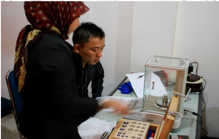
Gambar 8 Proses Calibration