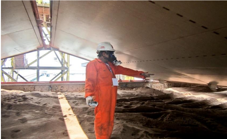
Gambar 6 Ruang Lingkup Pekerjaan Fumigation

tersebut masuk ke dalam wilayah negara tersebut yang akhirnya berdampak pada kerugian materi dan kepercayaan pelanggan.