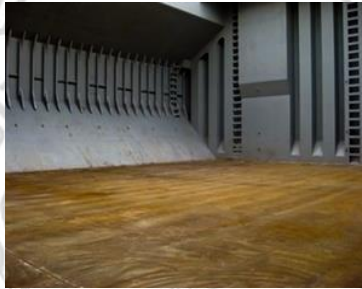
Gambar 3 Ruang Lingkup Pekerjaan Marine Cargo Survey