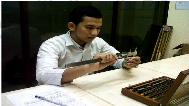
Gambar 9 Proses Calibration