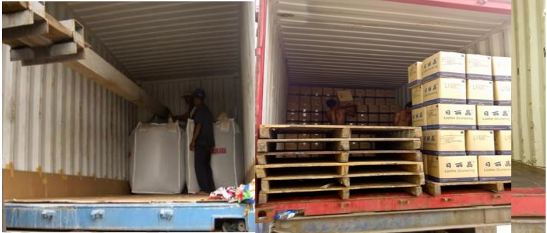
Gambar 5 Ruang Lingkup Pekerjaan General Cargo Survey

sebagai salah satu dokumen untuk melengkapi persyaratan dalam dokumen contract.