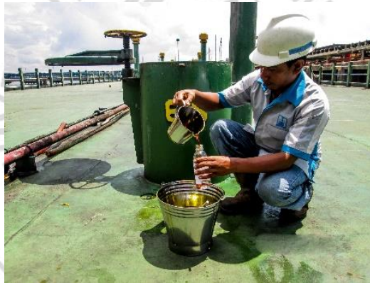
Gambar 1 Sounding Tanki