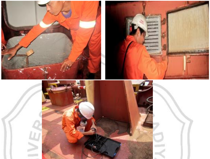
Gambar 7 Proses Fumigation