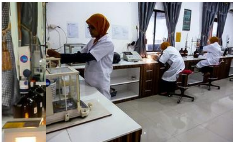
Gambar 11 Proses Analytical Sample