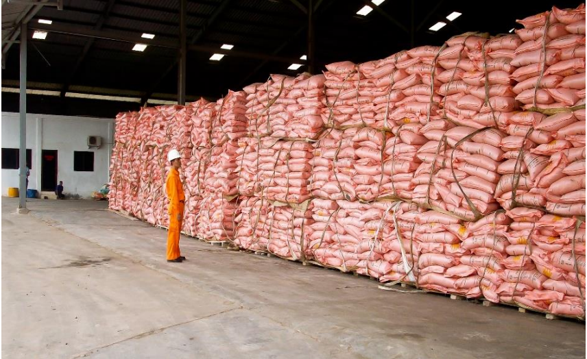
Gambar 4 Cargo Survey